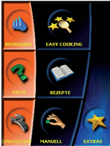
Bildschirmansicht nach dem Einschalten