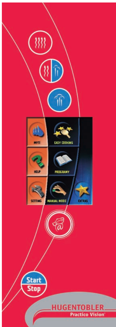
Bedienungs-Panel des Kombisteamers Practico Vision

Im oberen Teil des Panels über dem Display befinden sich drei Tasten für die Wahl der Betriebsarten: Heissluft, Kombidampf oder Dampf. Unter dem Display finden Sie die Tasten „VISION AGENT“ und „START/STOP“.